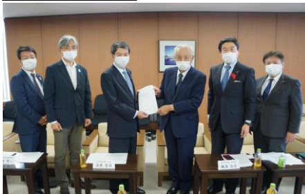
自由民主党札幌市支部連合会 「政策要望懇談会」