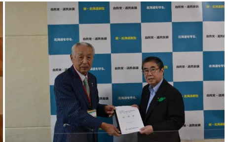
自由民主党・道民会議 商工業振興議員連盟