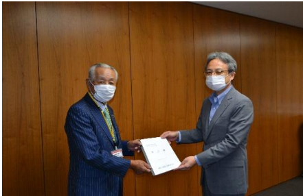
北海道経済産業局