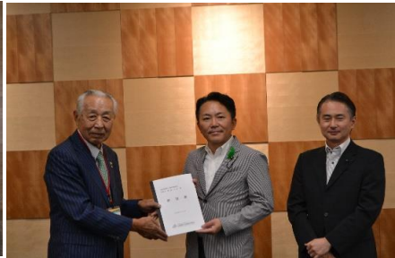
北海道議会 経済委員会