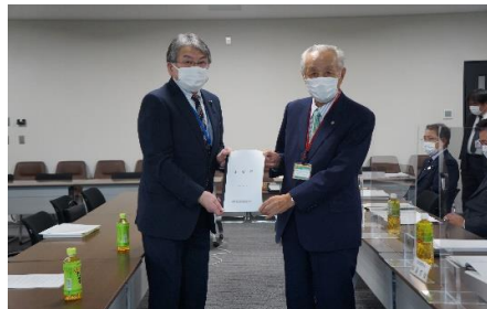
自由民主党北海道支部連合会、 自民党・道民会議北海道議会議員会 「団体政策懇談会」