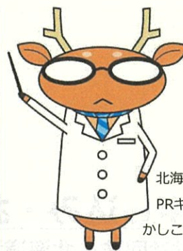
北海道消費者教育 PRキャラクター かしこしか

インターネットにつながったパソコンやスマートフォン・タブレット等で受講する講座です。配信期間内であれば、いつでも好きな場所で講座を受けることができます。