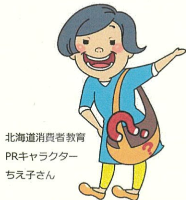
北海道消費者教育 PRキャラクター ちえ子さん