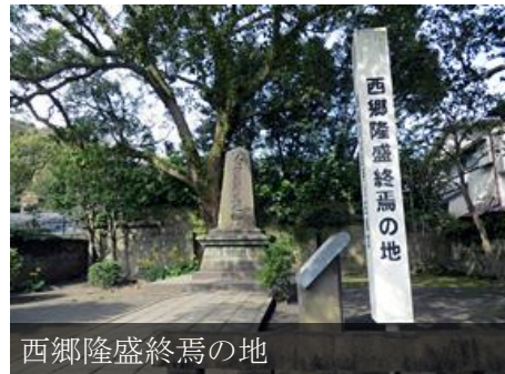
西郷隆盛終焉の地