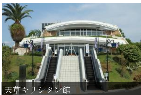
天草キリシタン館