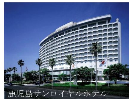
鹿児島サンロイヤルホテル